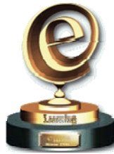
eLearning Award 2005 des eLearning- Journals