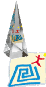
Initiativ-Preis Aus- und Weiterbildung 2005 des DIHT und der Wirtschaftswoche